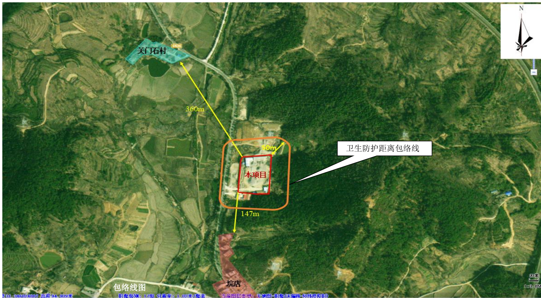
附图 5 项目卫生防护距离包络线图