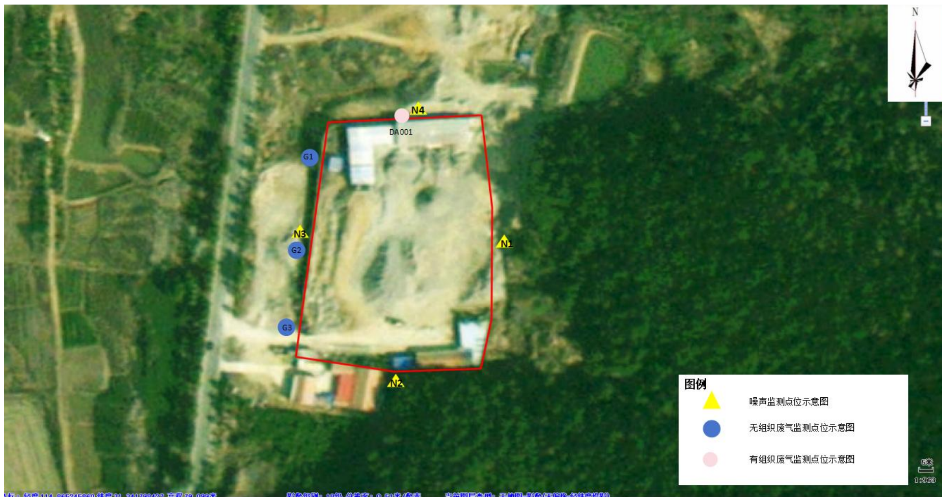
附图 4 项目验收监测点位示意图