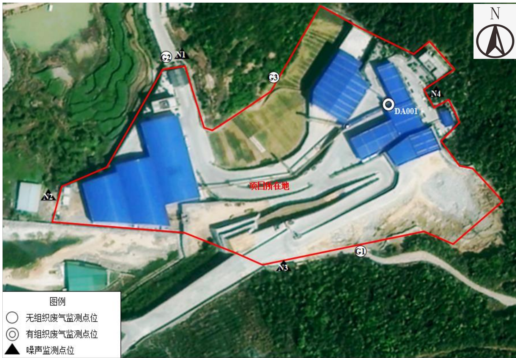
附图 5 项目验收监测点位图