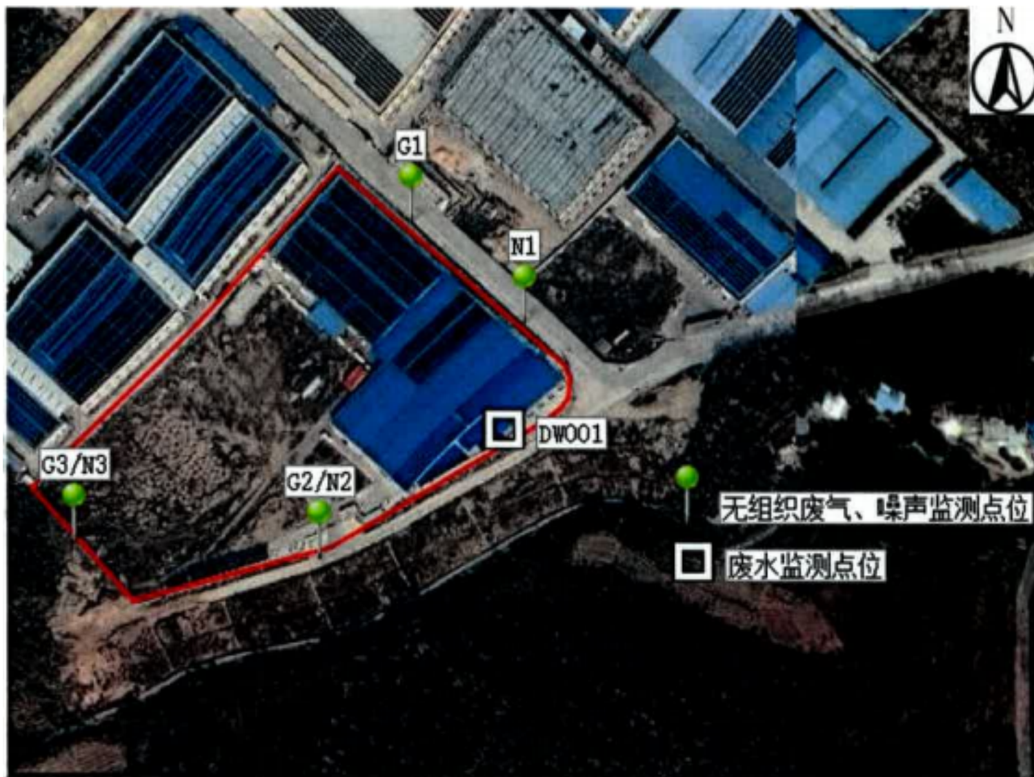
附图 4 项目验收监测点位示意图