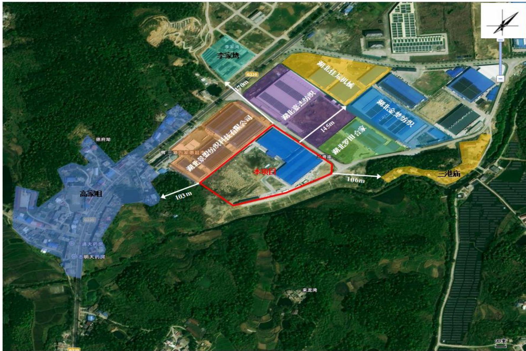
附图2 项目周边环境关系示意图